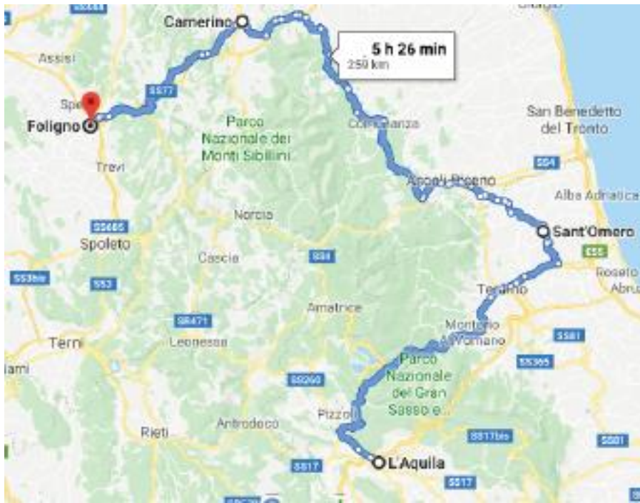
Percorso 25 settembre 2020